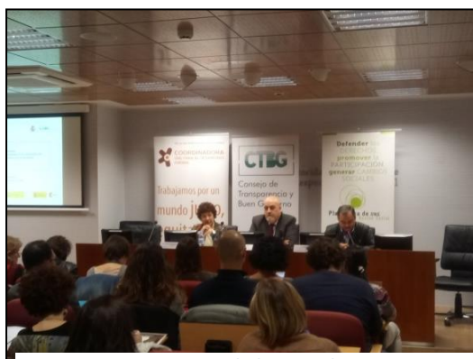
Apertura de la jornada

El pasado 8 de noviembre, se celebró la Jornada “Transparencia y Buen Gobierno en el Tercer Sector: nuestro compromiso con la sociedad”, una jornada muy especial organizada por la Coordinadora de ONGD España, la Plataforma de ONG de Acción Social y el Consejo de Transparencia y Buen Gobierno de España, cuyo objetivo principal era difundir la Herramienta de Transparencia y Buen Gobierno y los trabajos de actualización que se están llevando a cabo sobre la misma.