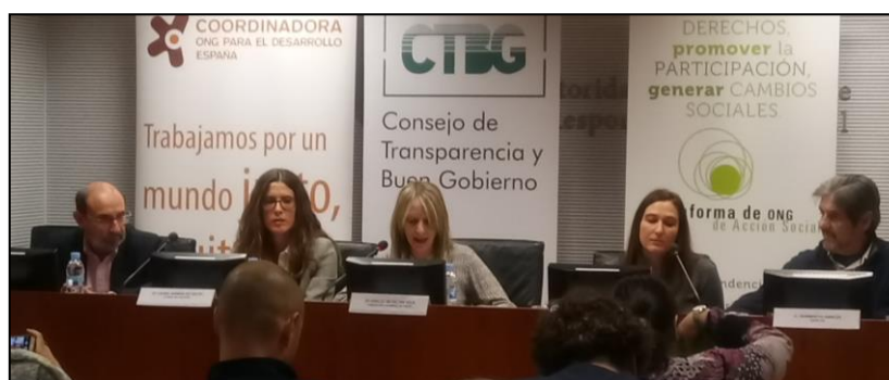
Mesa 4. Beneficios de una adecuada política de transparencia y buen gobierno. La contribución de la transparencia y el Buen Gobierno a las entidades sociales.

Durante la Mesa Redonda, que incluyó preguntas del público, surgieron varias ideas que constataron los puntos en común que tienen todas las ONG en materia de Transparencia, como es que esta sea una señal propia de identidad que va más allá de la propia ley o considerarla como una herramienta de confianza y de cohesión ya no solo hacia la sociedad, sino también dentro del Tercer Sector . También se destacó a la Transparencia como una herramienta que ayuda a resolver incidencias que la realidad trae consigo y como algo que va más allá de conseguir un mero certificado, ya que es lo que determina el compromiso de los ciudadanos con el sector. Por todo ello, y como conclusión final, se quiso destacar que la Transparencia es un proceso permanente de mejora donde se es gestor de lo público y de los fondos de los ciudadanos que eligen a las ONG para mejorar la vida de las personas .