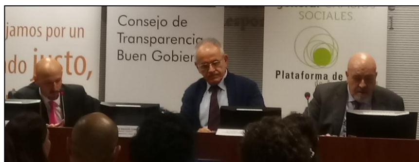
Mesa 3. Las obligaciones de las entidades del Tercer Sector respecto a la Ley 19/2013, de 9 de diciembre, de transparencia, acceso a la información pública y buen gobierno

A lo largo de las tres ponencias se hizo una introducción a la metodología de evaluación ( MESTA ) y al seguimiento de la transparencia de la actividad pública, se remarcaron las obligaciones de la Ley Nacional y las de las Transposiciones Autonómicas. Al final del artículo se puede acceder a las tres ponencias para ver todo el contenido del que se habló durante esta sesión.