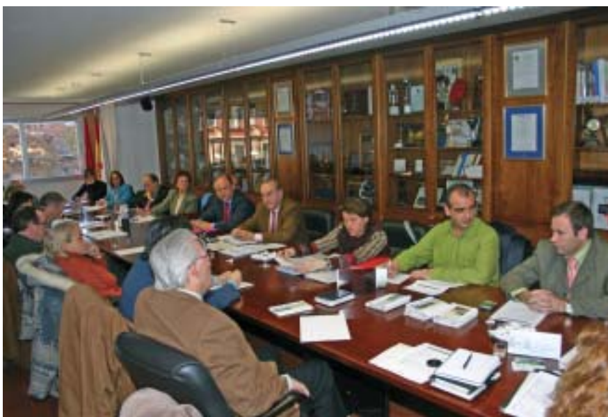
Reunión de la Asamblea de la Plataforma, integrada ya por 25 organizaciones.

Con los objetivos citados, se creó una comisión que desarrolló sus trabajos durante el segundo semestre del año, realizando una encuesta interna que ha servido para recoger las expectativas de los socios en relación con el futuro de la organización. Las conclusiones se expondrán en una jornada de reflexión, con la que se pretenderá concretar una nueva formulación de la misión y visión de la Plataforma. También, identificar objetivos a corto y largo plazo, dentro de un Plan Estratégico revisado.