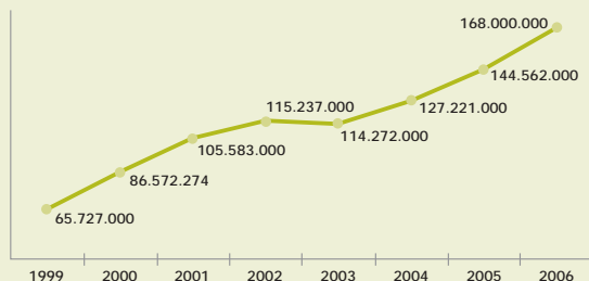
Evolución del dinero recaudado para fines sociales durante los últimos años (en E)

Por otro lado, se apostó por la creación de un microsite y otras herramientas de difusión vinculadas a este canal. En solo dos meses, la