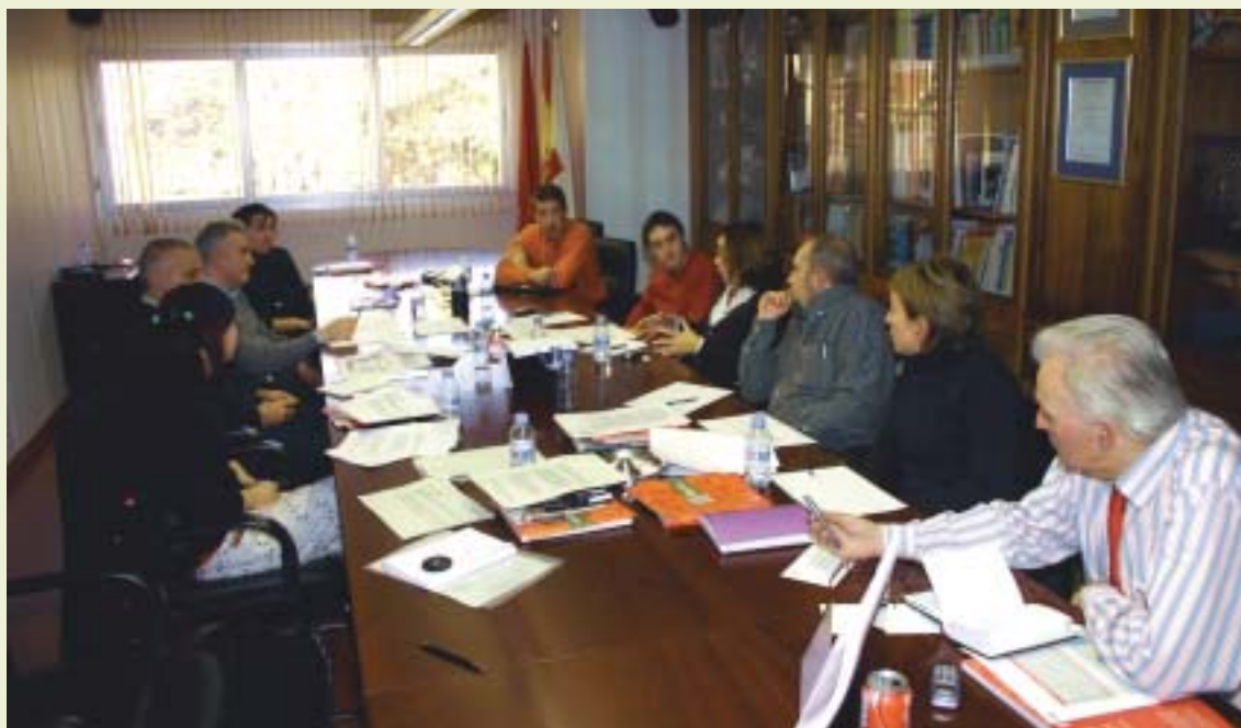
Comisión de Comunicación de la Plataforma.