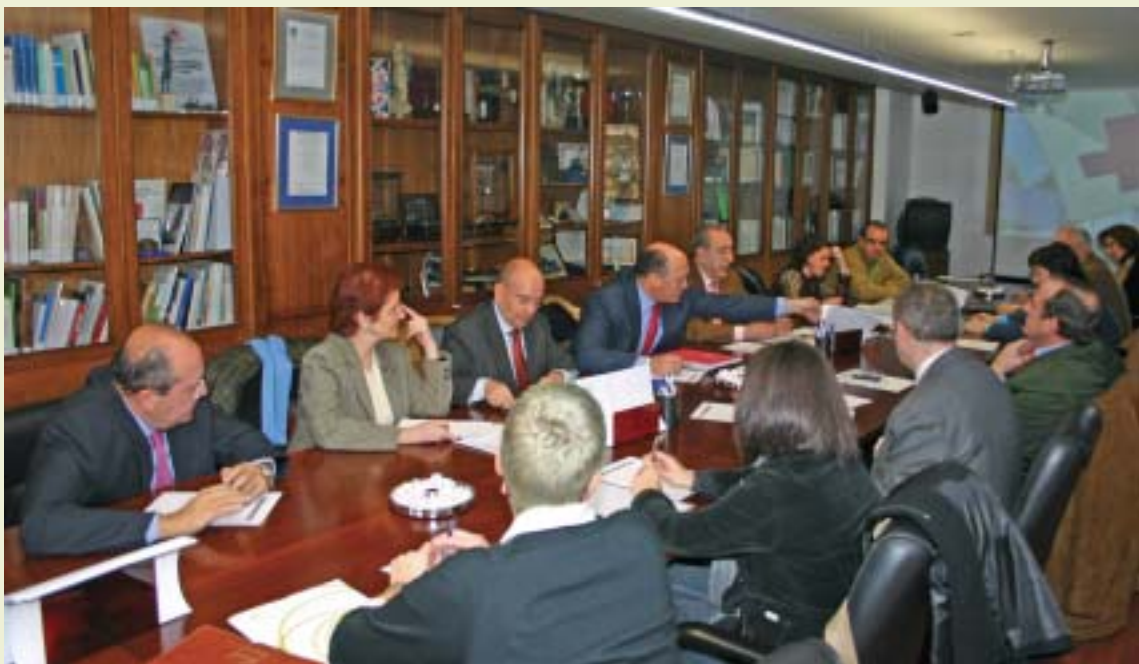
Reunión de la Junta Directiva de la Plataforma.