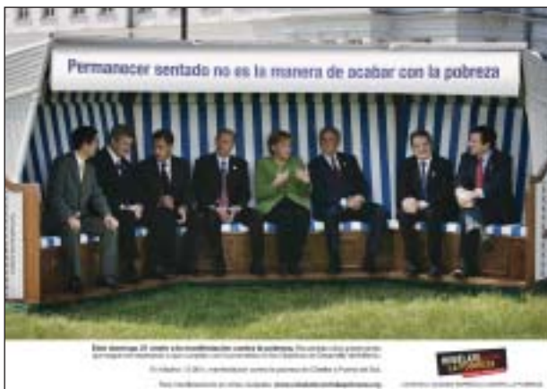
Alianza contra la pobreza.

Se dio continuidad a la colaboración que se viene manteniendo con la Asociación de Organizaciones No Gubernamentales usuarias del Marketing Directo (AOMD) y la Coordinadora de ONG para el Desarrollo (CONGDE).