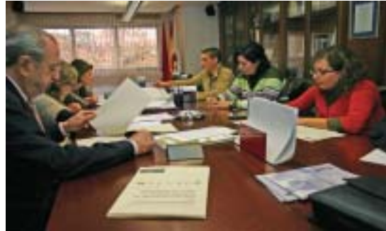
Reunión del Foro de Agentes Sociales, en la que se cerró el acuerdo sobre la Agenda Política.

Las recomendaciones y conclusiones alcanzadas por los grupos fueron remitidas a la Vicepresidencia del Gobierno en febrero de 2008, recordando el compromiso adquirido de elaborar una ley específica en esta materia para el sector.